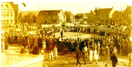
Terrein kerk, Koninginnedag 1930

Er zijn nog diverse foto's van vóór de bouw en tijdens de bouw.