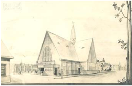
Ontwerp architect Nieuwpoort