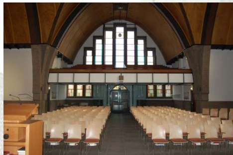
Interieur na aanpassing kerkzaal 2009

Er was bij een deel van de gemeente de wens om de kerkzaal multifunctioneler in te richten. Ook was een deel van de gemeente gehecht aan de oude kerkzaal, met zoveel herinneringen daarin. Er is een zorgvuldige procedure gevolgd, met inspraak voor alle partijen, die uiteindelijk heeft geleid tot de huidige bijzonder mooie inrichting. Een inrichting die bestaat uit losse stoelen, plavuizen, nieuwe entree, beamer en nog veel meer.