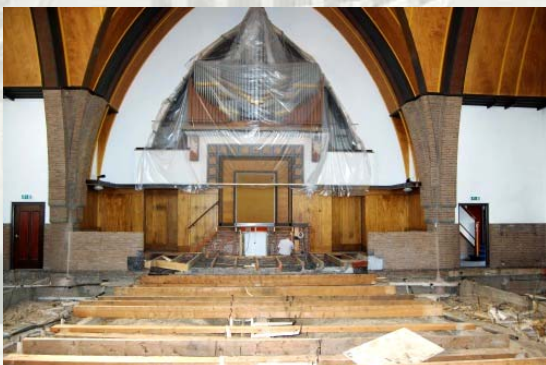
Tijdens de aanpassing van de kerkzaal in 2009