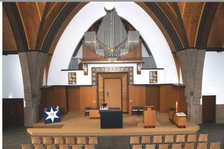
(boven) Front na aanpassing kerkzaal 2009