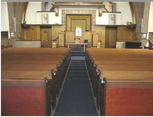
(boven en onder) Interieur na 2000