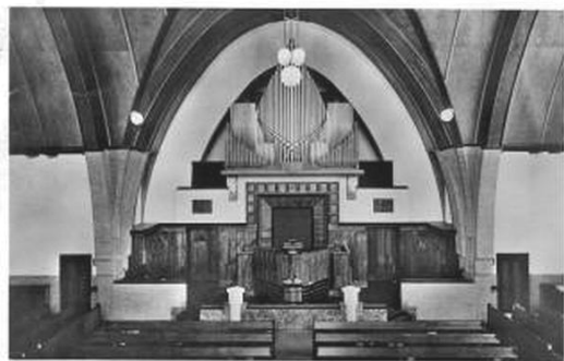
Front met voorlezersgestoelte