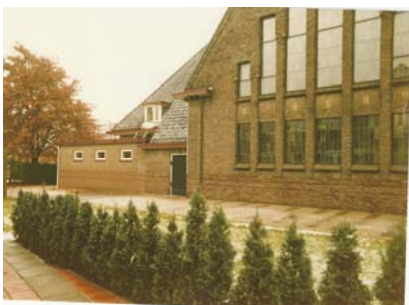
Zijkant kerk met aanbouw 1964

De verschillende verbouwingen/aanpassingen van het kerkgebouw.